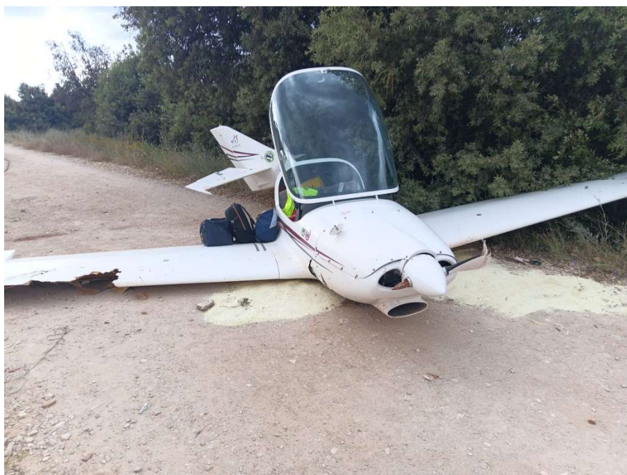
Slika 2 - zrakoplov nakon nesreće

Nakon što su 33 zrakoplova uredno sletjela vidjeli su da se dogodila nesreća gdje je zrakoplov izletio ulijevo od staze 10. Zrakoplov se zaustavio na makadamskom putu koji se proteže paralelno sa uzletno sletnom stazom. Pritom je teže ozlijedio biciklisticu i lakše ozlijedio dvije pješakinje koje su tada bile na spomenutom makadamskom putu. Pilot zrakoplova, Francuski državljanin nije zadobio nikakve ozljede, a putnica u zrakoplovu također Francuska državljanica zadobila je lakše tjelesne ozljede.